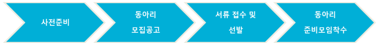
해비타트 준비모임단계 - 준비모임착수까지 과정

대학동아리 설립 절차는 동아리 인준을 기준으로 그 이전인 동아리 준비모임 단계와 인준 이후의 인준동아리 단계로 구분된다.